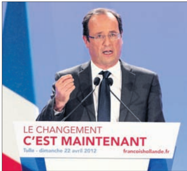
Den oranan di anochi a ser conoci cu e Socialista Francois Hollande a resulta ganado di e prome buelta presidencial na Francia y lo bringa pa e hefatura di Francia contra e actual mandatario Nicolas Sarkozy.

ser conoci cu e Socialista Francois Hollande a resulta ganado di e prome buelta presidencial na Francia y lo bringa pa e hefatura di Francia contra e actual mandatario Nicolas Sarkozy. Di acuerdo cu e prome contamento di e votamento, e candidato di Partido Socialista a haya mas cu 28% di e voto dilanti di Sarkozy kende a logra apenas un 25.5%.